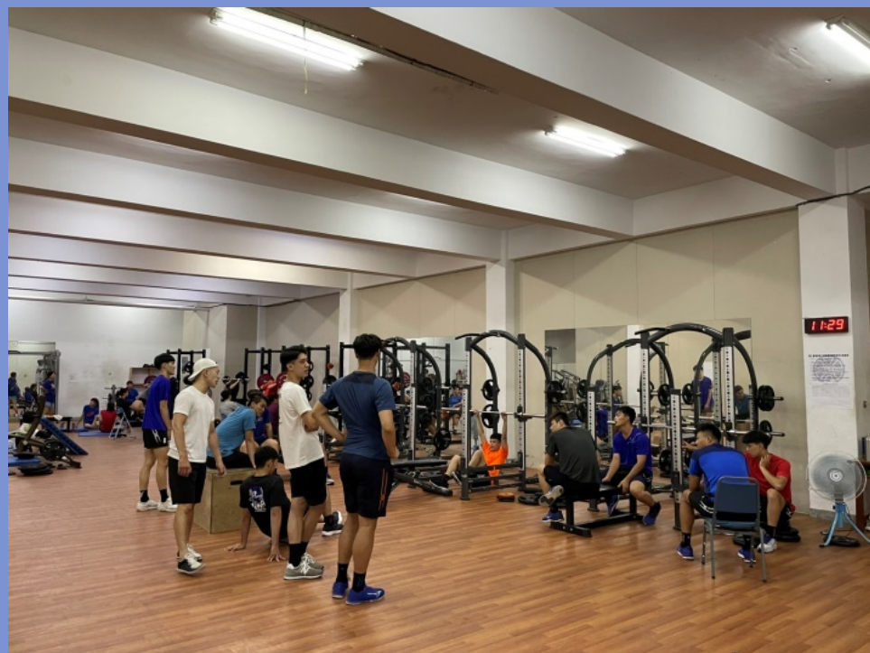
公館校區中正堂地下一樓 12:10~13:20、19:30~21:30 (其餘時間依現場公告)