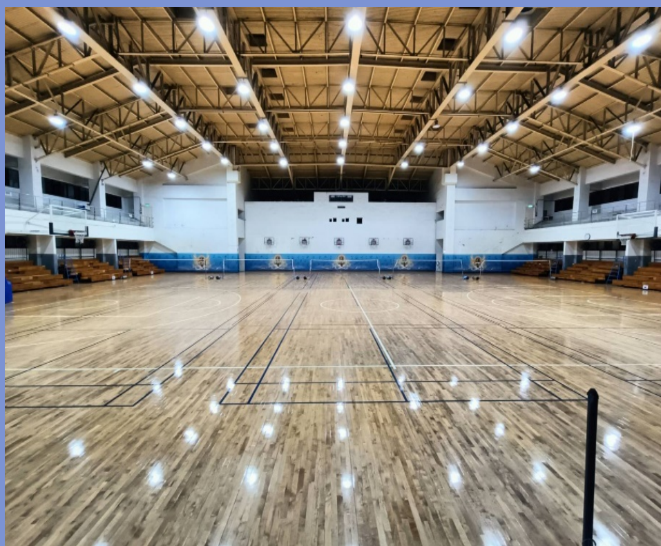
林口體育館B1重訓室 12:00-13:00