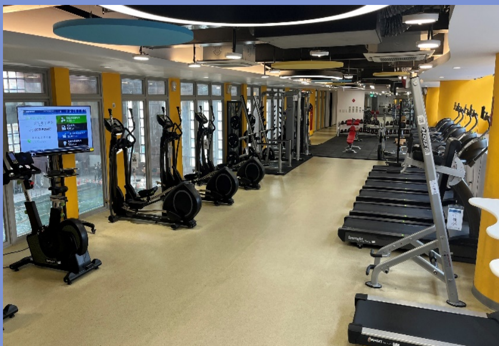
游泳館四樓智能健身中心 08:00-17:00