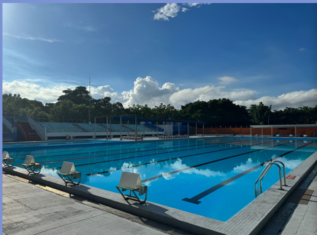
林口游泳池 夏季開放，日期時間以體育室 官網公告為準