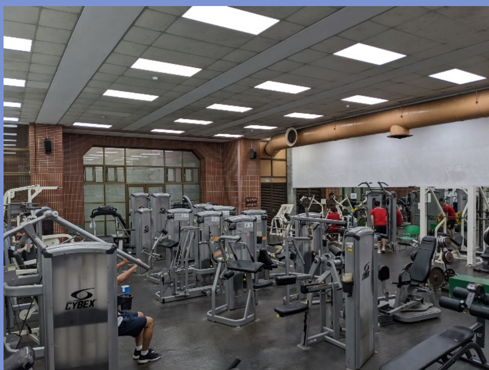
和平校區I體育館地下一樓 8:00~22:00